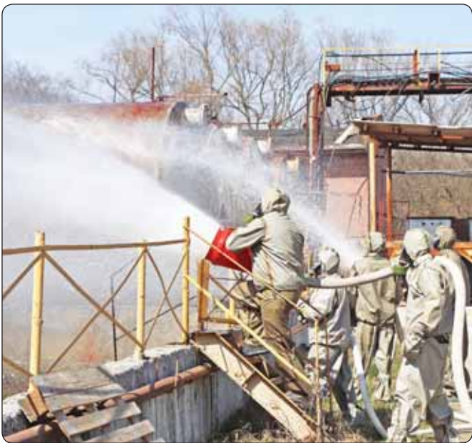
Урысей МЧС-м и Управленэ нэхъыщхъуэ КъБР-м щылэм и пресс-лүэхуцлэплэ.

- Мыпхуэдэ зыгъэсэныгъэхэм я флыгъэккэ гупыр нэхъ-ри хуэхъзыр мэхуэ шынагъуэ зыпылх химие пкыы-гъуэхэр джэщылэ объектым шынагъуэншагъэр къы-щызэгъэпэщыным. Щытыккэ гугъум тэмэму дыккы-ккы, ди къалэнхэр нэсу дгъэзэщлэщ, - жилащ зы-гъэсэныгъэхэр зи нэлэм щлэта, щыналхэ МЧС-м ма-флэсыр гъэункыфынымрэ аварие-къегъэлыныгъэ лэжьыгъэхэр егъэккынынымккэ и управленэм и уна-фэщлэ Къэгъэзэж Анзор.