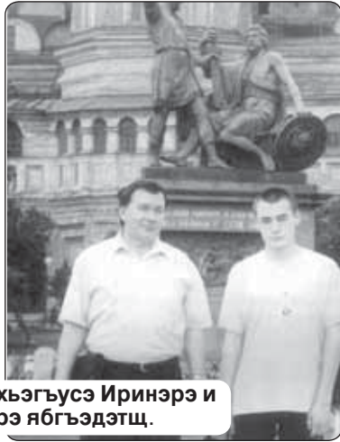
Тхьэгъэзит Юрэ и щьэгъусэ Иринеэ и кьуэ Муслымрэ ябгъэдэтц.

кьыщыгъэщ адыгэ романым изэфлуэвэкламрэ ищытыккэмрэ кьэгъэлхьэуэным ли-тературэдж зыбжанэ зэрелэжьар, псалгэ хьарзынэ куэди зэрыху-жалар, ауэ жалам и нэхьыбэр зытеухуэр ди литературэм кьы-кьуа гьуэгуанэм и тхьидэр арауэ зэрыщытыр.