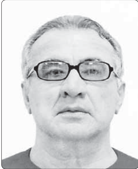
Ауэ щыхуэу, тхылъкIэ сыкъращцIэ сы-зыхуэдэ цIыхур».

Къыхэдгъэщынщи, и анэдэлъхубзэм-рэ урысыбзэмрэ нэсу зэрищцIэм къа-дэкIуэ, еджагъэшхуэр хуити иропсалъэ франджыбзэми латиныбзэми. Лъэпкъ-хэм я зэныбжэуэгъуэм и университету Москва дэтыр, Лумумбэ Патрис и цIэр зезыхъуэ щытар (иджы РУДН), ех-улIэныгъэкIэ къиухри, Семэным илъэс куэдкIэ студентхэр щригъэджащ Бе-нинрэ Ганэрэ я зэхуаку дэлъ Того къэрал цIыкIуэм щыIэ щыплэ еджаплэ нэ-хъыщхэм, Тулузэ (Франджы), Гент (Бе-лгийе) къэрал университетхэм, РУДН-м.