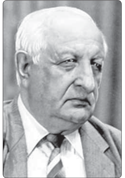
лъабжьэу романыр къыгъэщIын хуэ-фIэклаш.

Убых лъэпкъыр нобэ щымылэжми, абы я тхыдэр къэнэщ. Апхуэдэ гуауэ зи натIэ хъуа куэди щыIуэ къыщIэклэ-къым. Шинкубэ, мы романымкIэ зы-хуигъэувыжа къалэныр къехуулаш. Ар зытетхыхыжар зы цыху закъуэ и гъащIэкъым, лъэпкъ псом игъэвар дигъэлыгъуаж. Убыххэм я нэгъуэщIэ-кIам хуэдабзэщ адрей бгырыс лъэпкъ-хэми - адыгэхэми, абхъазхэми, шэсэн-хэми, осетинхэми, абазэхэми - я фэм дэklar, я натIэ хъуар. Ауэ абыххэм я насыпщ: хэщIыныгъэшхуэ ягъуэтами, убыххэм хуэдэу мыкIуэдыжыпIуэ, лъэпкъ мащIуэ къызэтенэн яхуэ-фIэклаш. А псоми я щхъэфэ йолэбэ Шинкубэ и романымкIэ, и гур мзуэ и лъэпкъым папщIэ. А гурыгузымрэ и лъэпкъым хуилэ фылыгауныгъэмрэ и