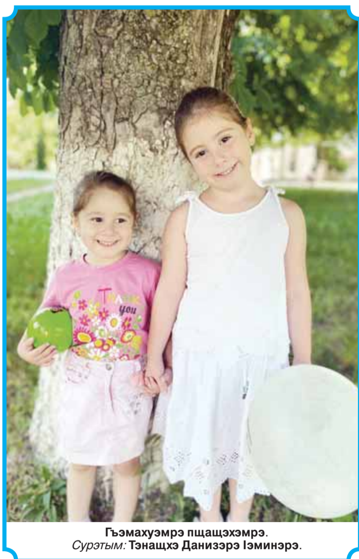
Гэмахуэмрэ пщажэхэмрэ. Сурэтгым: Тэнашхэ Даниэрэ Гэминэрэ.

Бажэм жёл: - Иджы мыр дауэ тшын? Хьэ хуэдэу тшын-къым, уарэзымэ, хабзэклэ тшынш.