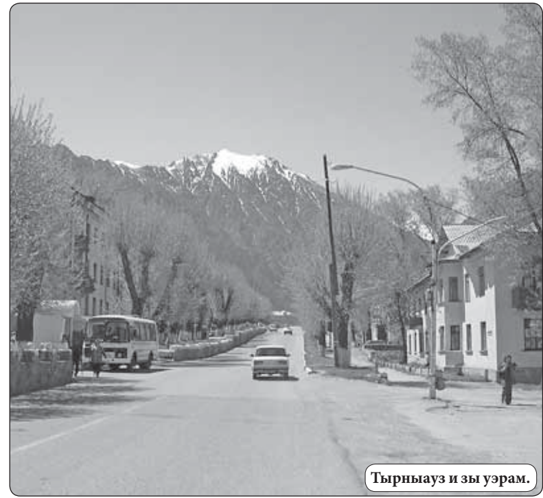
Тырнауз и зы уэрам.

23.30 - 24.00 «Акъ таулары жырлары» (балькэрыбзэкIэ)