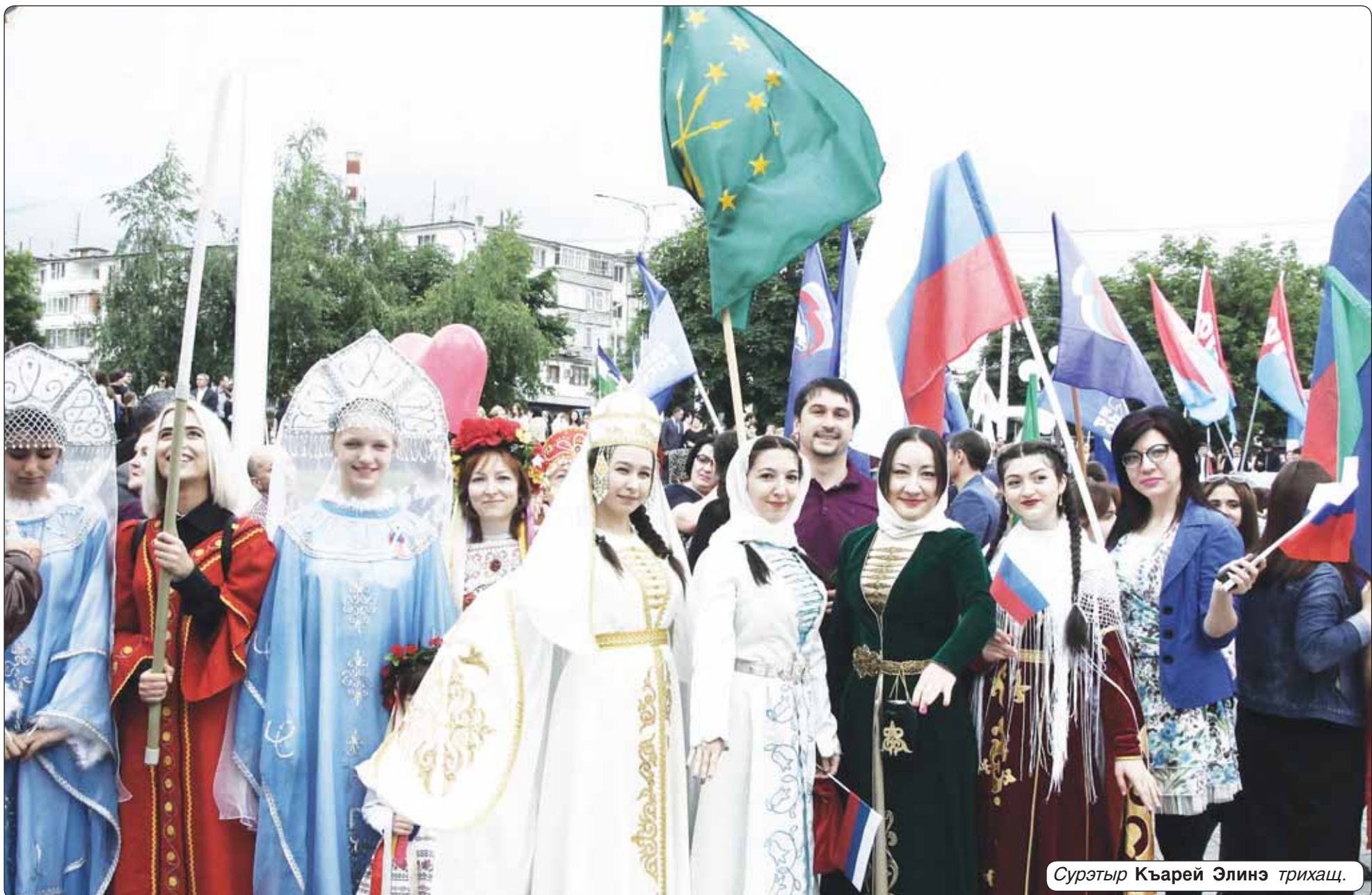
Сурэтыр Къарей Элинэ трихаш.