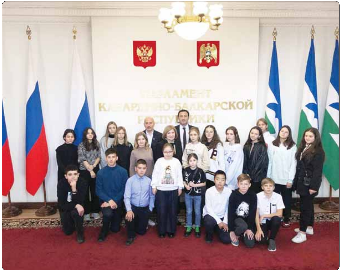
КЪБР-м и Парламентым и пресс-луэхушлэлэ.

Ныбжыщлэхэм КЪБР-м и Парламентым и Унэм зыщрагьэп-лъыхьащ, иужьым зэгъусэу сурэт зытрагьэхаш.