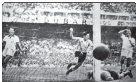
Гиджа Альсидес Уругвайм текуэныгъэ кышхуэзыкыа топыр Бразилием и гъуэм дегъэкл. 1950 гъэ.

1942, 1946 гъэхэм футболымкIэ еклүкIынуу хуея дунейсо чемпионатхэр ЕтIуанэ дунейсо зауэм и зэрэн-кIэ зэхъаткыным. 1950 гъэм Бразилием кышыцэра-гъэлэца дунейсо зэхъээхуэм и саугъэт нэхъышхъэм шIэбэнэуэ шытар командэ кышхэ 13 къудейш - ар дунейсо чемпионатхэм я тхыдэм кърIубыдуэ гуп нэхъ