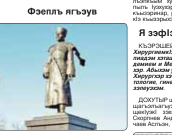
АДЫГЕЙ. РеспубликӀэр кызырархуэуэр илӀэси 100 зырыркӀур ирӀыкӀылуэ Мей-кӀышӀа гъагъуащ АдыгӀе обкомым и лӀэ секретару шӀыцӀэ, АдыгӀе автоном обкомым и кызырархуэуэхэм ялӀыщӀэ зы ХьыкӀуэра ШыкхьӀэ-Джэри и ФӀеплӀэ. ААО-м и лӀэ унафӀытым и ФӀеплӀэр жӀыж кыкӀы-шӀыкӀыкӀа, метри 3,2-рӀэ и лӀагъагӀ. Ар кыкӀыкӀуэхэм хэтӀэ АР-и и Игъашхьэ КӀуымлӀэ Мурат, АР-и и КӀэрал Совет-Хасэм и тхьмадӀэ Нарожный Владимир, АР-и и КӀэрал чӀанджӀагъуэ ТхьэлӀукуэ Аслъэн, УрӀсейм ЛӀыкхьӀыкӀуэ ЛӀы-хуэж, УФ-и и Жылгауэ палатӀэ жӀэ Маш-булар, Игъашхьэ, КӀэрал, жылгауэ лӀыкхьӀэ-кӀуэр, шӀыналгъэм.