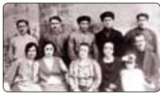
Тыншылэ хушлэккуакым 2-нэ пап.