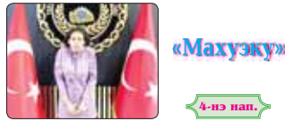
«Махуэку» 4-нэ пап.