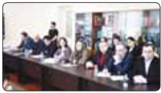
Пэжыр к'алыкхуэуэ 2-нэ пап.