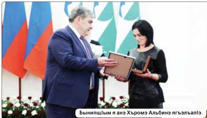
БынитщӀым я анэ Хъромэ Альбинэ ягӀэлӀапӀэ.