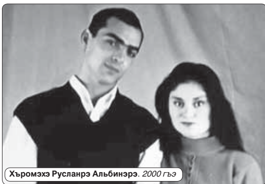
Хьромэхэ Русланрэ Альбинэрэ. 2000 гъэ

Къыпхуэмылэуэтэным хуэдиз мыхъэнэ иррэ гурыщIэ абра-гуэрэ къызэщIэзыуэбидэ пса-лъэу цыIэр а зыращ: хьэр-фышхуэ защIэкIэ дапщIэци птхыну зыхуэфашэ АНЭ пса-лъэрэщ. Анэм игури и псэри сьт цыгъуи хуэлэухащ быным. Адэм унагъуэм цыIэ мыхъэ-ншхуэр зыкIи дымыгъэ-лъахъшэу жьыдIо: «Анэр бы-ным я нэхуэ, я гъащIэ гъуа-зэщ, я щалхъэщ».