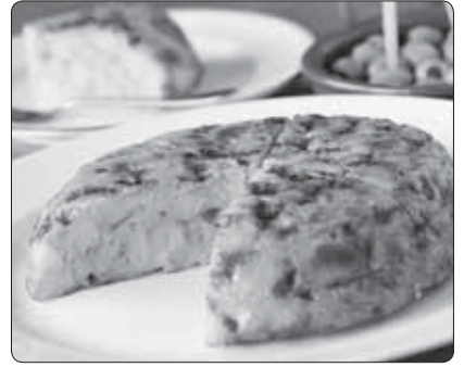
иралъхъэри, лэнэм трагъэуэвэ. Дашх палстэ, шлэ-кхъуэ.

Клэртлоф укъэбзар г 5 - 6 хъу зэппллэмэ цыкылуэрэ яупщлатэ, шыгъу хадзэри, дакыккэ 3 - 4-ккэ шагъэт. Бжыныхури якуккэбэри, лупщлэ цыкылуэрэ яупщлатэ. Адэккэ джэдыккэрэ аудэри, шыгъу хадзэ. Итланэ тебэм тхуу иралъхъэри кыагъэпллэ, абы клэртлоф упщлэта гъэжэпхэр хаклутэри, зэлэщлэурэ, тхууэпллэ хъуу ягъажъэ. Абы бжыныхур халъхъэри, зы дакыккэ хуэдиз-ккэ трагъэт, итланэ шыбжии хадзэри, зырызэлэ-щлэм хуэдэурэ, джэдыккэ удар хаклэри, и шхъэр траплэж. Мафлэр ешэхуэу дакыккэ зытлэщлэ ягъажъэ, и лъабжъэр тхууэпллэ хъухуккэ. Тебэм зэриллэу лупщлэ-пллэуэ зэпаупщлэ, зэрагъэ-дзэккэ, тебашхъэр траплэжри, аргуэру зы дакы-ккэ хуэдизккэ ягъажъэ. Пщтыру тепщэным