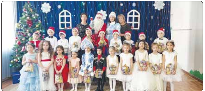
Ди газетым и къыккэлыкълуэ номерыр къыщыдэкълуэ 2023 гъэм шцышылэм и 10-рщ.