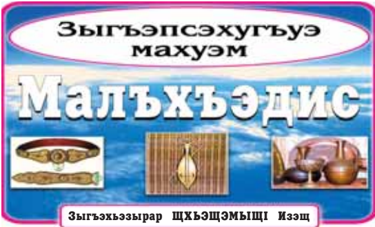
Зыгъэхъэзырар щхьэщэмьщИ Изэщ