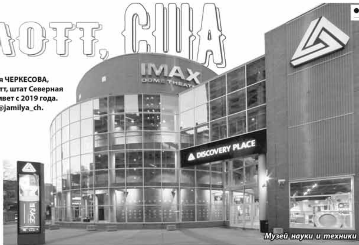
Музей науки и техники

Левинский музей Нового Юга – исторический музей, экспонаты которого посвящены жизни в Северной Каролине после гражданской войны в США. В музее есть временные и постоянные экспонаты, посвященные различным темам, связанным с Югом. Постоянная экспозиция музея называется «Хлопковые поля и небоскребы: Шарлотт и Каролина» и включает исторические экспозиции, отражающие историю региона. Экспозиции