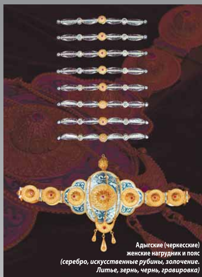
Адыгские (черкесские) женские нагрудник и пояс (серебро, искусственные рубины, золочение. Литье, зернь, чернь, гравировка)