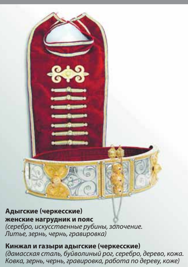
Адыгские (черкесские) женские нагрудник и пояс (серебро, искусственные рубины, золочение. Литье, зернь, чернь, гравировка)