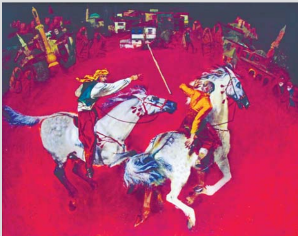
«Джирит», 2008 г.