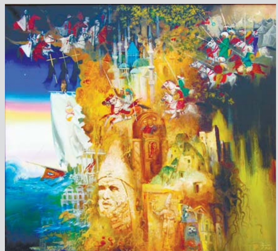
«Анатолия», 2013 г.

УЧРЕДИТЕЛЬ: ПРАВИТЕЛЬСТВО КАБАРДИНО-БАЛКАРСКОЙ РЕСПУБЛИКИ Главный редактор З.С. КАНУКОВА