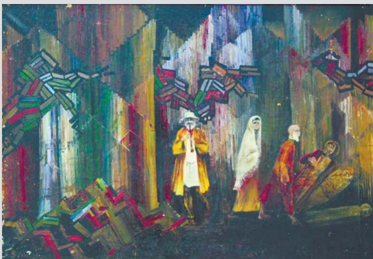
«Уход», 1960 г.