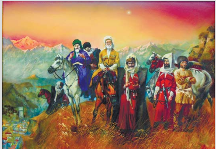
«Кавказский пейзаж», 2002 г.