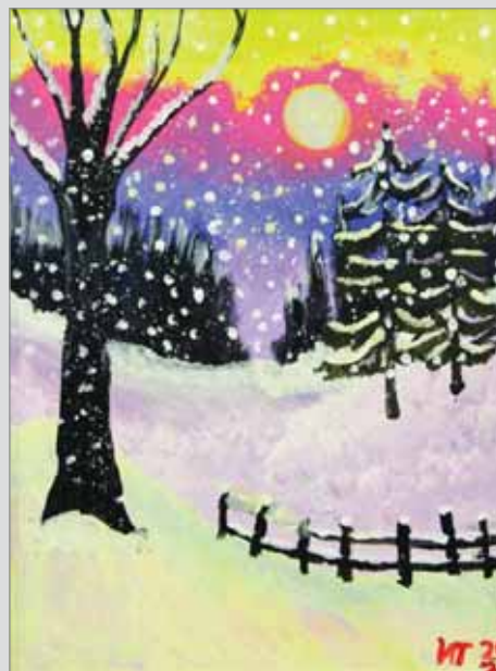
Имран Танашев (14 лет)