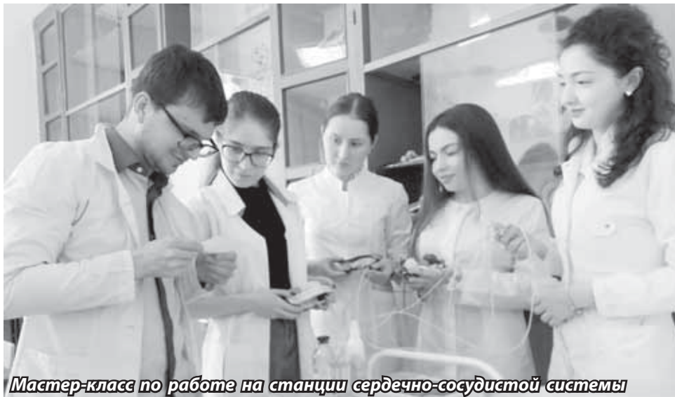
Мастер-класс по работе на станции сердечно-сосудистой системы

- Второй этап проекта тоже на стадии завершения. Это обучение студентами профильных направлений учащихся школ. В нашем регионе сейчас такое направление отсутствует, получается, мы стали первыми. Желание попробовать свои силы в нашей школе изъявили ребята медицинского колледжа, института химии и биологии, а также медицинского факультета КБГУ. Они рады открыв-