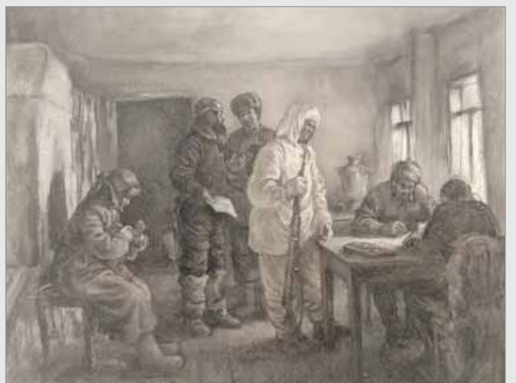
П. Пономаренко. «Фронтовые будни»

Бабушка рассказывала, что в мае 1945 года советских воинов-освободителей, возвращавшихся домой, везде встречали с ветками сирени. Время было тяжелое, было не до выращивания цветов. А сирень цвела рядом, радуя своим видом и ароматом. С тех пор и повелось считать это дерево одним из символов Победы.