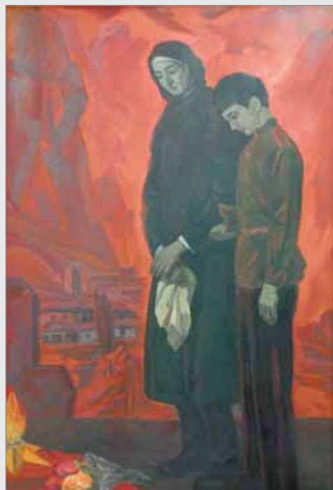
Н. Трындык. «Память»

В Кабардино-Балкарском музее изобразительных искусств им. А.Л. Ткаченко накануне Дня Победы открылась уникальная выставка «Этих дней не смолкнет слава», посвященная знаковым юбилейным датам в истории России, – 350-летию со дня рождения Петра I, 210-й годовщине победы в Отечественной войне 1812 года, 265-летию образования Российской Академии художеств и 77-й годовщине Победы в Великой Отечественной войне.