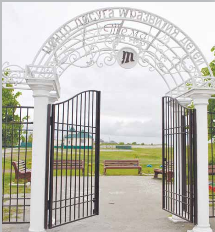
Кишпек - победитель районного конкурса среди сельских поселений Баксанского муниципального района КБР (с. 3)