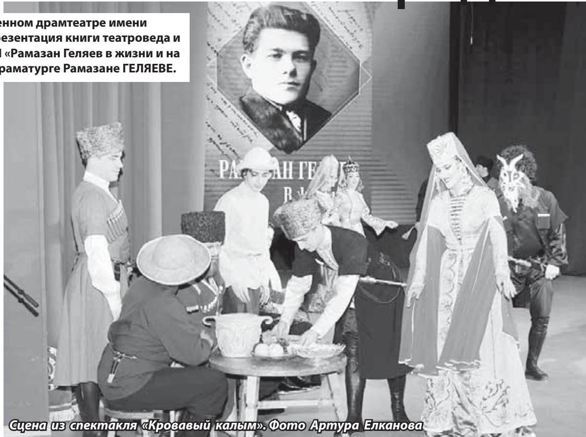
Сцена из спектакля «Кровавый калым».