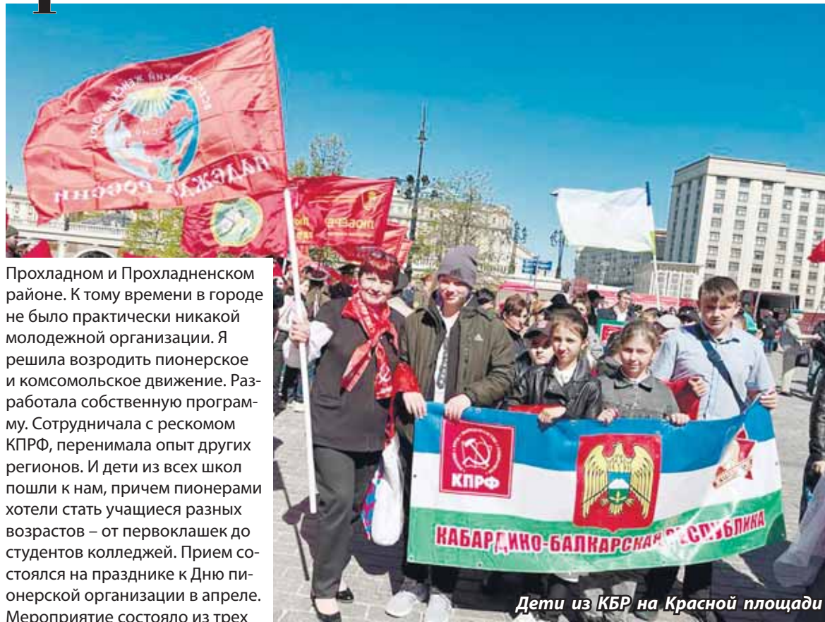
Дети из КБР на Красной площади

В 2021 году организовали детское пионерское движение в