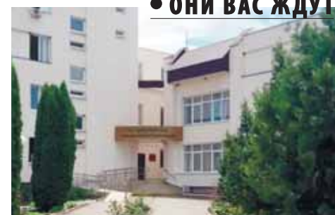
• ОНИ ВАС ЖДУТ

(Продолжение материала читайте в одном из ближайших номеров.)