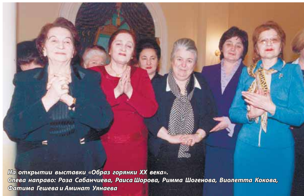
На открытии выставки «Образ горянки XX века».