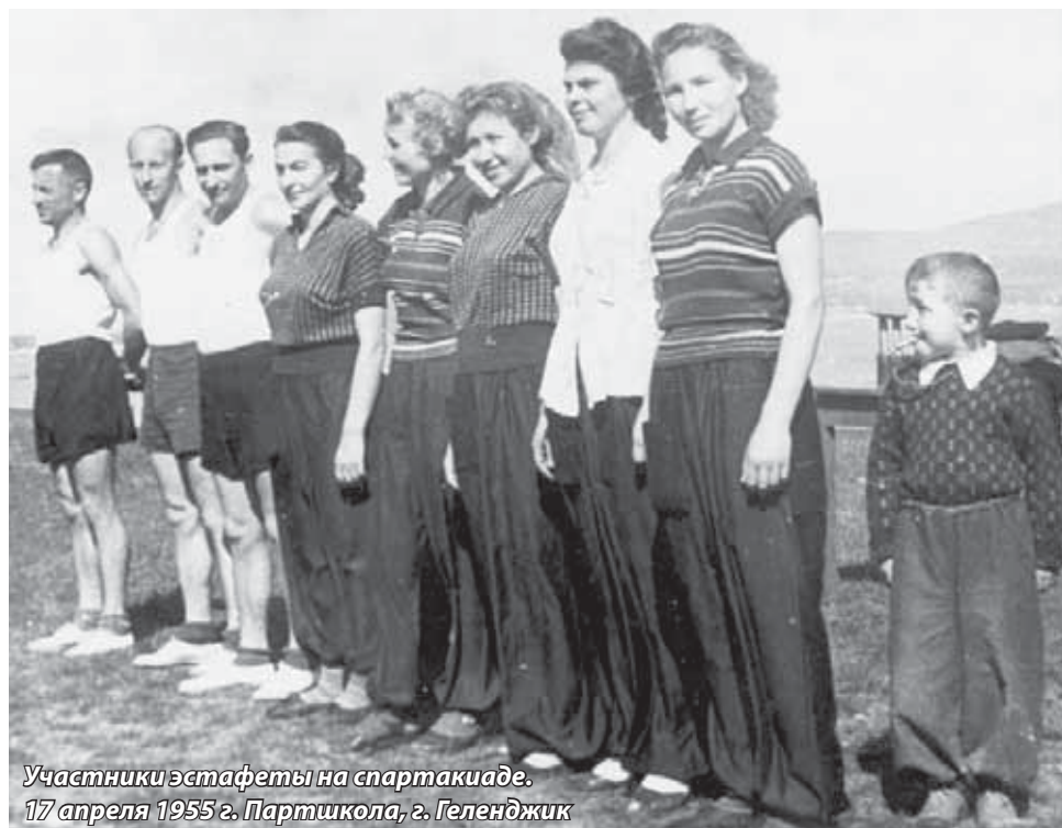
Участники эстафеты на спартакиаде. 17 апреля 1955 г. Партшкола, г. Геленджик

Я продолжила ваше дело. Но заводы, которые строили наши комсомольцы, а я была начальником штаба, уже не работают, курорт, где я помню строительство каждого объекта, сейчас стоит полуразрушенный. И человек труда, которому создавались все условия: бесплатное образование, медицина, доступное жилье, у которого была уверенность в завтрашнем дне, теперь абсолютно незащищен. Да и быть человеком труда и чести сейчас совсем не почетно и даже как-то странно... Настало время золотого тельца, но он не объединяет людей, а разъединяет. Отец, ты был образованным человеком, возглавлял государственный банк, был полон замыслов, отдал жизнь за прекрасное будущее народа... Таким ли ты его представлял? Советский Союз – страна для народа, но эта страна разрушена до основания... Моя исповедь – попытка зафиксировать события, где я была действующим лицом. Думаю, свидетельства от первого лица важны для потомков и истории. Вспоминаю одну поездку в Верхнюю Балкарию, где в горах неожиданно натолкнулись на склепы, а в селе Герпегеж – на монастырь-пещеру в горе... А как узнать их историю? Ничто так не подвергается фальсификации, как история. Криво толки, домыслы пишущих – будь то историки, писатели, журналисты, порой создают очень далекие от реальности картины, ложь зачастую довлеет над истиной, особенно тогда, когда нет достоверных источников. Отец, в моей исповеди тебе – правда об эпохе