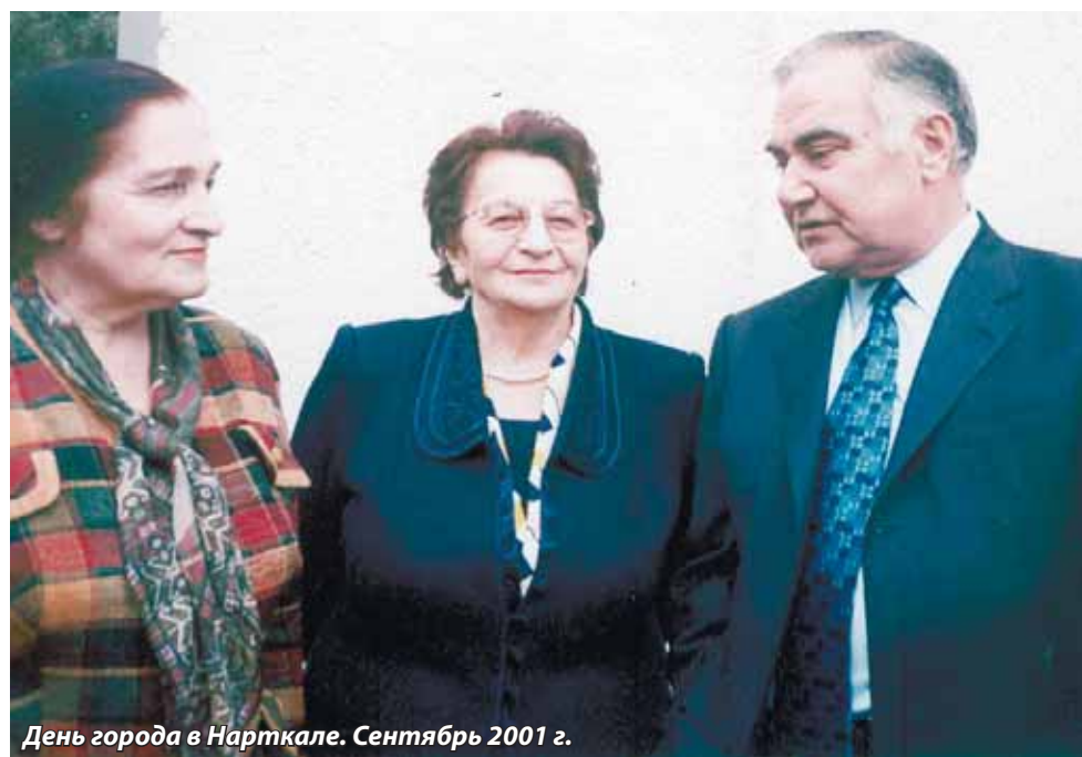
День города в Нарткале. Сентябрь 2001 г.