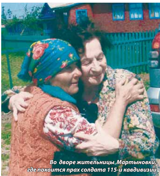
Во дворе жительницы Мартыновки, где похоронен прах солдата 115-й кавдивизии

Дорогой Отец, вот я и рассказала тебе о своей жизни. Исповедалась. Мне это было необходимо. Сказать тебе, что старалась быть достойной дочерью солдата, героя войны. Твоя мартыновская высота не только в моей дочерней душе, она - в памяти народной. Каждый выбирает свою дорогу по себе, мой выбор был предопределен тобой и моими дедом. Клянюсь вашему праху. Придут другие времена, и наше дело продолжится. Я верю в это. Ничего бесследно не исчезает. Отец, твой путь, моя дорога и пути моих дедов навсегда пересеклись и никогда не исчезнут. Прошлое нет, оно в настоящем и будущем. Здравствуй, Отец!