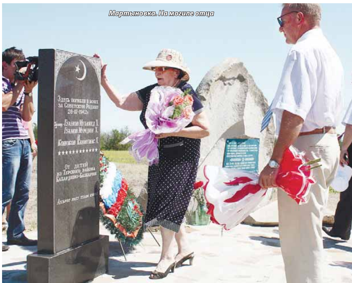
Мартыновка. На могиле отца

Отец, я понимаю, эпохи меняются. И я далека от того, чтобы идеализировать наше время. Но все же невозможно опровергнуть факт: идейные люди ушли в небытие. И время идей истекло. Должны появиться общенациональные идеалы, которые могут нас сплотить. И лидеры, которые будут их исповедовать. Думаю, если будет реальный план развития республики и будут искоренены кумовство, клановость, будут равные права у всех, общество снова сможет объединиться и работать на благо республики. Социальное государство, социальные гарантии не должны быть погребены, выброшены, как