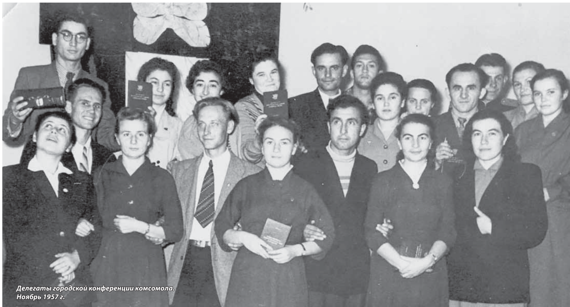
Делегаты городской конференции комсомола. Ноябрь 1957 г.