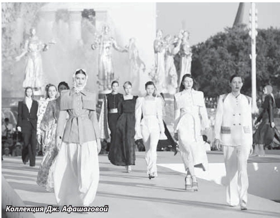
Коллекция Дж. Афашаговой