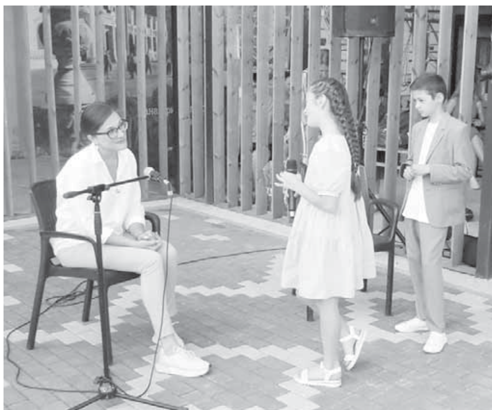
На прошлой неделе единственная молодежная газета республики «Советская молодежь» (ныне «Молодежка») отпраздновала свой 83-й день рождения. Печатное издание, учрежденное Правительством республики, выходит в Кабардино-Балкарии с 1939 года.