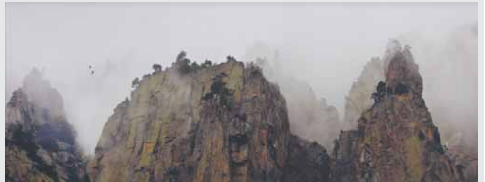
Эльбрусский район. Скалы Эльджурт