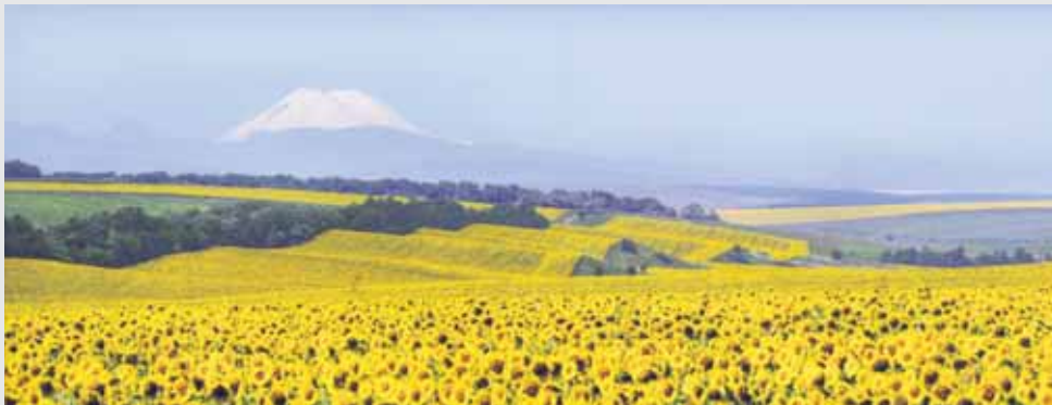
Зольский район. Подсолнухи