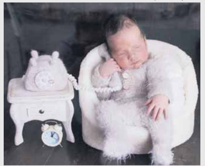
Ф. Халилова. Из серии «СЛАДКИЙ СОН». Фото

Лилиана ШОРДАНОВА.