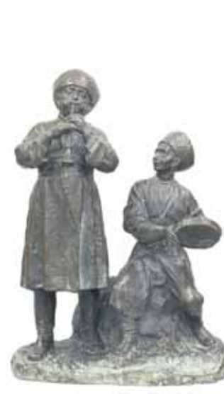
В. Славников. «Музыканты», 1968 г.