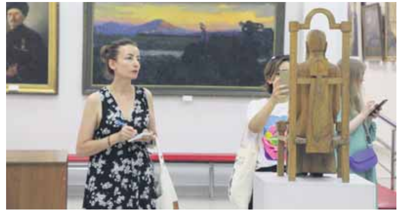
Экспозиция в зале музея