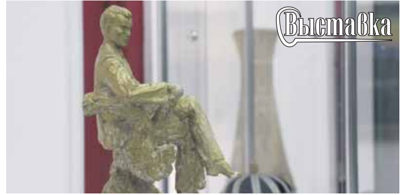
М. Тхакумашев. «Портрет Али Шогенцукова», гипс тонир.