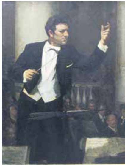
В. Плотников. «Дирижер Ю. Темирканов», 1971 г.