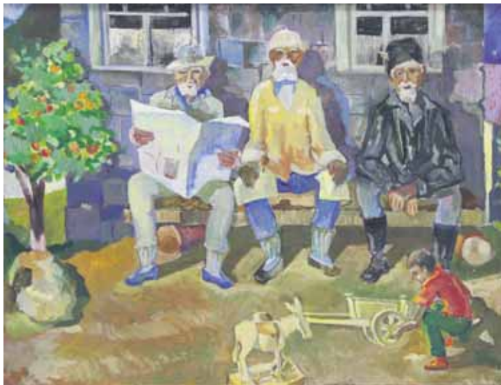
В. Курданов. «Ровесники Октября», 1988 г.