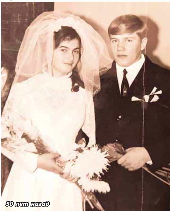
50 лет назад

Когда родился первый ребенок, с завода ушла, устроилась в теплоэнергетическую компанию и проработала там 46 лет. Ра-