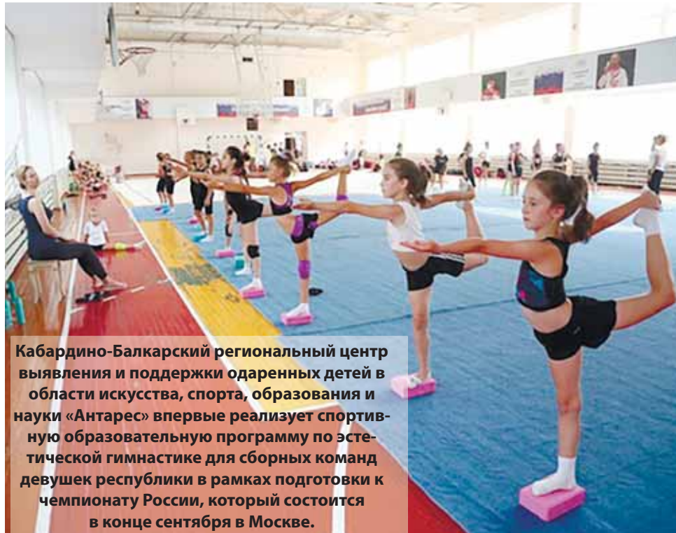
Кабардино-Балкарский региональный центр выявления и поддержки одаренных детей в области искусства, спорта, образования и науки «Антарес» впервые реализует спортивную образовательную программу по эстетической гимнастике для сборных команд девушек республики в рамках подготовки к чемпионату России, который состоится в конце сентября в Москве.

Девочки очень рады возможности быть вместе. Обычно все в разных школах в разные смены занимаются, а здесь все вместе учатся, едят и тренируются. Они чувствуют себя самостоятельными. На прошлой неделе в первый день сборов писали сочинение на тему, чего ждут от этой смены,