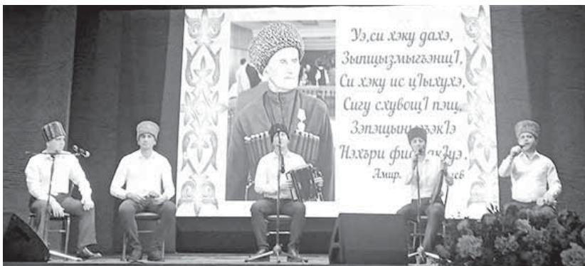
На прошлой неделе в Государственном музыкальном театре г. Нальчика состоялся вечер памяти Амирхана Асхадовича ХАВПАЧЕВА, посвященный 140-летию со дня рождения народного поэта, заслуженного деятеля искусств Кабардино-Балкарской Республики, хранителя адыгского национального фольклора.

мастера инструментального и вокального искусства, распорядители игрового круга. Среди них недооцениваемые Ляша АГНОКО, Бекмурза ПАЧЕВ, Кильчуко СИЖАЖЕВ и, конечно, универсальный в различных проявлениях Амирхан Хавпачев. О них в свое время писали наши первые литературоведы Джансوخ НАЛОЕВ и Хачим ТЕУНОВ. Обладая феноменальной памятью, Амирхан Хавпачев сохранил сотни высокохудожественных произведений народного творчества: геро-