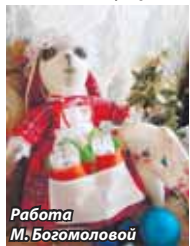
Работа М. Богомоловой

Рукодельницы – по определению люди творческие. Новый год для них – особый повод проявить свои умения, попробовать новую технику, удивить людей и устроить праздник для своей души.