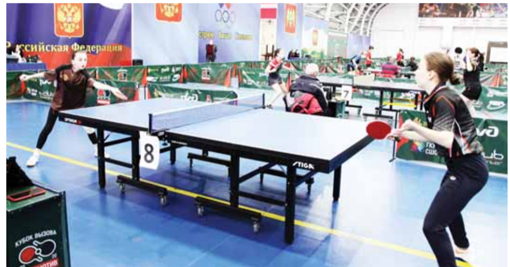
Материалы рубрики подготовил Альберт ДЫШЕКОВ.

В смешанных парах второе место у дуэта Чегадудев – Аджанян. Третье место у пар Ацканов – Фаридат Куашева и Сибеков – Апшева. Финал чемпионата России, в который прошли мужская и женская сборные КБР, перенесён из Сочи в Оренбург. Ближайшие соревнования в Нальчике – первенство СКФО среди спортсменов до 19 лет – намечены на февраль. Они пройдут, если позволит ситуация с пандемией коронавируса.