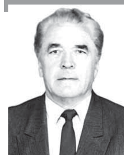
Это был уникальный человек, широко известный в научных кругах как крупный исследователь природы Северного Кавказа.