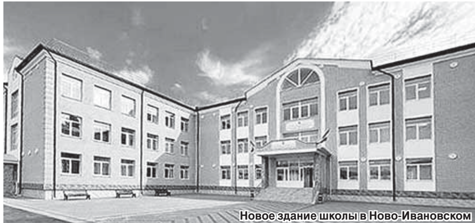
Новое здание школы в Ново-Ивановском

Центр цифрового и гуманитарного профилей «Точка роста» получила и школа №9 станицы Александровской. В рамках проекта «Формирование комфортной городской среды» в поселении благоустроен сквер. Строительство водопровода протяжённостью 8,6 км позволило внести существенное улучшение в систему водоснабжения сельчан. Не забыли и о культурном объекте