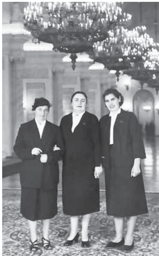
Третья сессия Верховного Совета РСФСР пятого созыва 25-27 октября 1960 г. Москва-Кремль

Подготовила Ирэна ШКЕЖЕВА.