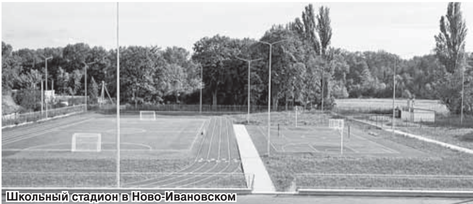
Школьный стадион в Ново-Ивановском

В последние несколько лет на территории Майского муниципального района проведена большая работа по реализации комплекса социально значимых проектов, которые дают ощутимый эффект. В частности, пристальное внимание уделяется объектам социальной инфраструктуры. В районном центре в 2019-2020 гг. введены в эксплуатацию дошкольный корпус к школе №3 и ясельный к гимназии №1 на 40 мест каждый. 89 новых мест для дополнительного образования были открыты в пяти образовательных организациях г. Майского. Оборудованный по последнему слову техники центр цифрового и гуманитарного профилей «Точка роста» получила третья школа районного центра. База ряда учреждений образования пополнилась современной компьютерной и мультимедийной техникой.