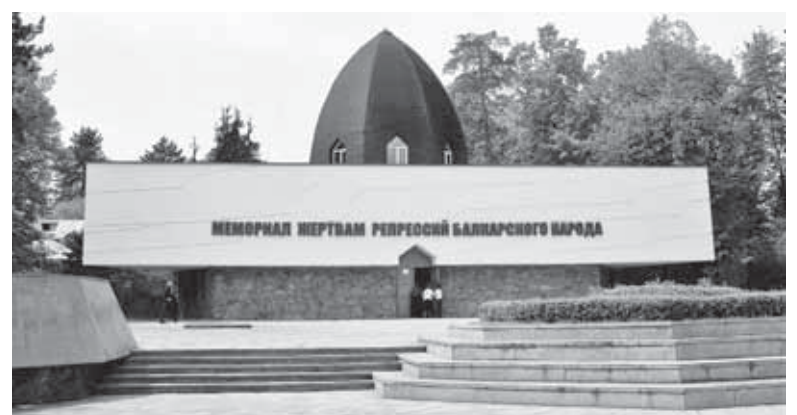
Мемориал жертвам репрессий балкарского народа