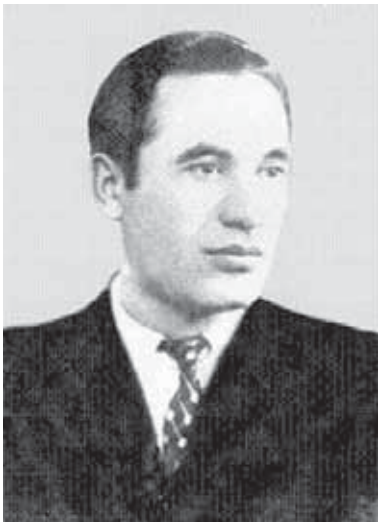
Танцор, певец и композитор Билял Каширгов

1 марта 2002 г. – организовано Кабардино-Балкарское региональное отделение политической партии «Единая Россия».