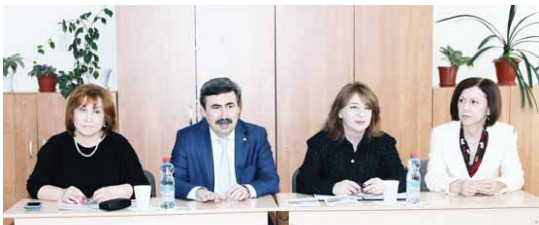
В школе №27 г. Нальчика состоялись открытые уроки и мастер-классы, посвящённые Всероссийской неделе математики, которая проходила в стране с 14 по 20 марта.