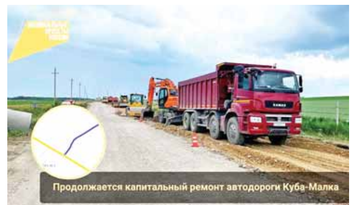
Продолжается капитальный ремонт автодороги Куба-Малка

Дорожники обновят покрытие и установят наружное электроосвещение, искусственные неровности, необходимые дорожные знаки, нанесут разметку. Завершение всех строительных-монтажных работ и сдача объекта в эксплуатацию запланированы до конца 2022 года.