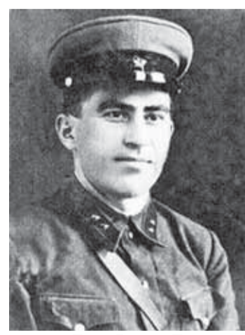
Поэт Борис Таов (1917–1942)

Мария Касимовна Темрокова (Канаметова) – первая солистка ансамбля танца «Кабардинка».