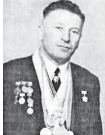
Хусейн Залиханов – альпинист, заслуженный мастер спорта СССР

Герой Советского Союза Григорий Климентьевич Атаманчук. 23 августа 1992 г. – в г. Нальчике учреждена Адыгская (Черкесская) международная академия наук (АМАН).