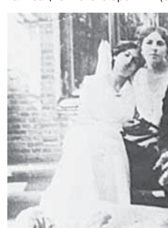
Фёдор Шалапин в Долинске. 1917 г.

утверждено «Положение об объединении Кабарды и Балкарии». 19 августа 1902 г. – в слободе Нальчик родился Владимир Михайлович Киришин – русский советский писатель, публицист, драматург, поэт, сценарист, редактор, автор слов песни «Я спросил у ясеня...».