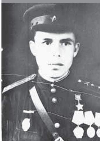
Герой Советского Союза Григорий Атаманчук (1922–1994)

Кроме того, отменяется ежеквартальное представление страхователем в территориальный орган Фонда социального страхования отчёта об использовании средств, направленных на финансовое обеспечение