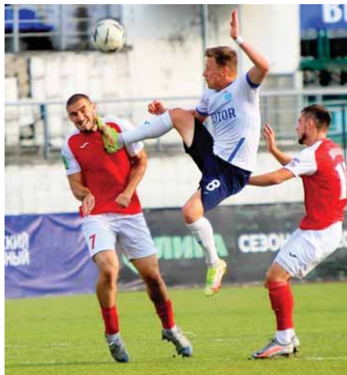
действий судьи, которые наш клуб оставляет без внимания не намерен.