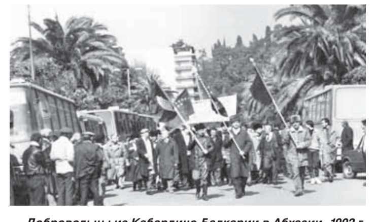
Добровольцы из Кабардино-Балкарии в Абхазии. 1992 г.

Август 2017 г. – в Приэльбрусье стартовала международная альпиниада, посвящённая 25-летию образования Союза Независимых Государств, 100-летию Великой Октябрьской социалистической революции 1917 г. и 50-летию юбилею