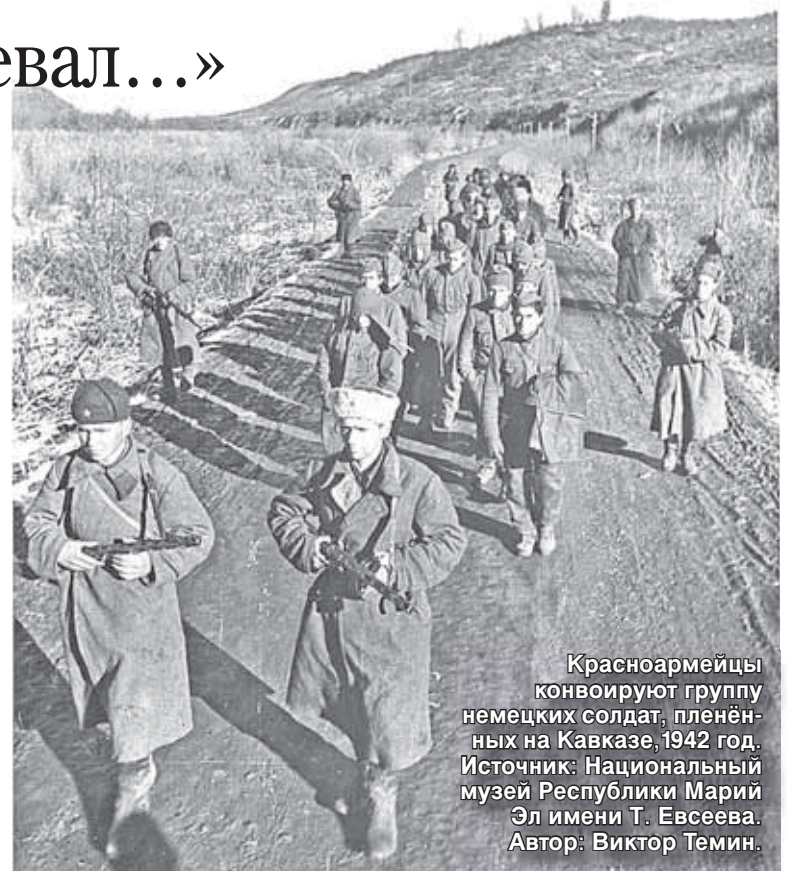
Красноармейцы конвоируют группу немецких солдат, пленённых на Кавказе, 1942 год.