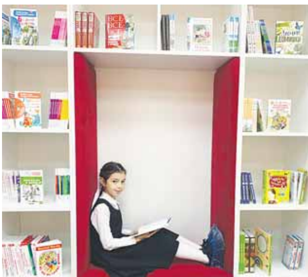
Литературная гостиная принимает юных посетителей