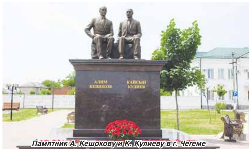
Памятник А. Кешокову и К. Кулиеву в г. Чегеме