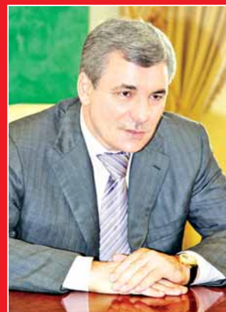
Арсен Баширович Каноков (2005-2013)