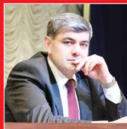
Казбек Валерьевич Коков (с 2018 по настоящее время)