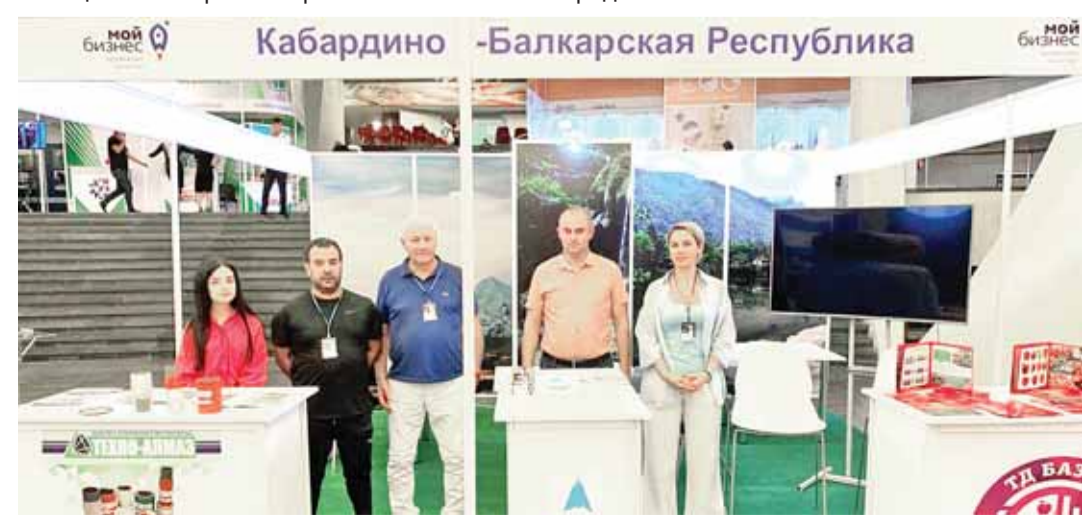
Подготовила Василиса РУСИНА

некоммерческой организации дополнительного профессионального образования «Школа экспорта» Российского экспортного центра для более чем 100 экспортно ориентированных предприятий в Кабардино-Балкарии, проведено восемь обучающих семинаров «Школы экспорта» РЭЦ по организации экспортной деятельности, в которых приняли участие 78 субъектов МСП. Кроме того, состоялся вебинар с предпринимателями республики на тему поддержки экспорта в условиях санкций. До конца 2022 года планируется ещё три обучающих семинара «Школы экспорта» по организации экспортной деятельности. Также в планах – участие предприятий республики в двух зарубежных и одной российской международных выставках, вывод одного субъекта малого и среднего предпринимательства на электронную торговую площадку Турции, сообщает пресс-служба Министерства экономического развития КБР. Работа в рамках развития международного сотрудничества, а также в области внешнеэкономической деятельности продолжается.