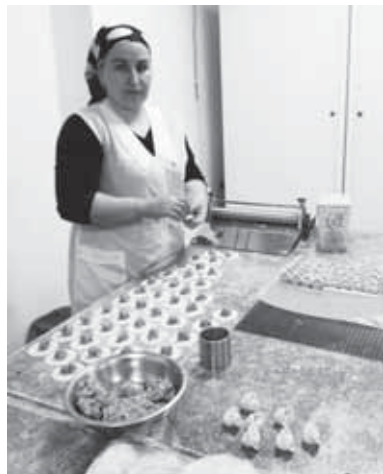
ПОМОЩЬ НАУЧИТЬСЯ ЗАРАБАТЫВАТЬ

Если вы давно мечтали открыть своё маленькое дело, но каждый раз финансовые барьеры блокировали ваши предпринимательские инициативы, то пришло время обратиться за помощью к специалистам республиканского Центра труда, занятости и социальной защиты, филиалы которого есть во всех муниципалитетах. Уже несколько лет успешно апробируются различные меры государственной помощи социально незащищённым семьям и гражданам. Одна из таких мер – социальный контракт. Это соглашение, заключаемое гражданином и местной службой соцзащиты населения на срок от 3 до 12 месяцев.