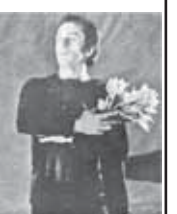
Министерство культуры КБР, Союз театральных деятелей КБР, Государственный музыкальный театр КБР

Светлая память о добром, талантливым и отзывчивом человеке навсегда останется в наших сердцах.