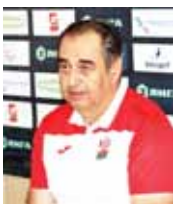
Второй фактор — за исключением нескольких команд, остальные выстраивают игру от обороны, защищаются чуть ли не всей командой. Нужно иметь соответствующее мастерство, чтобы вломать плотную оборону, над этим нам надо работать.

— Здесь всё очевидно: команда играет лучше там, где поле позволяет. Ни в коем случае не упрёка работникам стадиона, они делают всё, что могут. Но это уже вопрос инфраструктуры. Газону уже 16 лет, а всё имеет свой срок. Если поле выедем, игра замедляется, и в таких условиях легче разрушать, чем создавать. Отмечу и тот факт, что в этом году каждую неделю газон использовался для игр юношеской лиги. Такая нагрузка поле не выдержало. Можно, конечно, кардинально изменить стиль игры, найти двух габаритных форвардов, забрасывать на них мячи и играть «бей-бег». Но это не то, чего мы хотим. Конечно, поле не может быть ключевой проблемой, но оно необходимый инструмент.