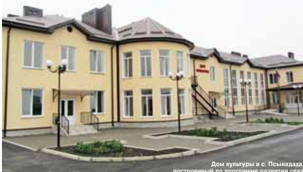
Дом культуры в с. Псынадага, построенный по программе развития села

Глава Кабардино-Балкарии Казбек Коков в ходе недавнего выступления перед региональными парламентариями сделал акцент на масштабных мерах государственной поддержки села в рамках федеральной программы «Комплексное развитие сельских территорий».