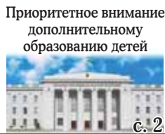
Приоритетное внимание дополнительному образованию детей