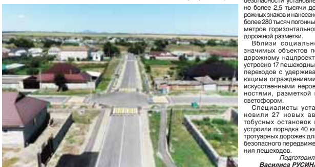
Подготовила Васисла РУСИНА

Специалисты установили 27 новых автобусных остановок и устроили порядка 40 км тротуарных дорожек для безопасного передвижения пешеходов.