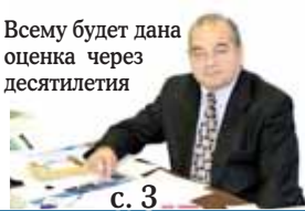
Всему будет дана оценка через десятилетия