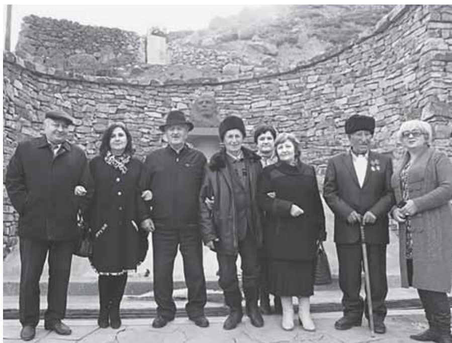
Къайсын туугъан юйде къонакъда