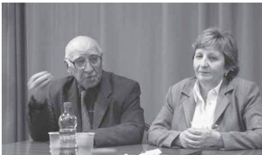
Тейтеланы Алим бла Мусукаланы Сакинат