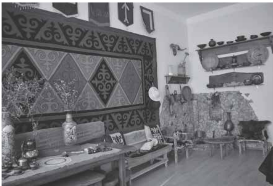
Маданият араны отоуунда

Таулу халкъны баш ышанларындан бири – билеклик эте билгендеди, къыйналгъаннга болушхандады, жунчугъаннга эс жыйдыра билгендеди. Аны себепли маданият арада кѐп кере жандаууарлукъ акцияла къураладыла. Сабий юйлеге болушлукъ этилгенлей турады: аш-суу, кийим, оюнчакъла, техника. Жыл сайын ѳтдюрюлген «Таулу хычинни байрамында» жыйылгъан ачхагъа, кереклерине кѐре, анда тургъан сабийлени кѐллери жарыкъ этер умут бла, гитче байрамла да къураладыла. Къыйын ауругъан адамлагъа деп, жылгъа бир ненча кере къан берген акциялагъа да сабийле бек суюп къатышадыла, жюрекден жюрекке баргъан болушлукъ теркирек ийлешдирир, къысха заманны ичинде сау болурла деген ийнаныу хар бирини ичинден жылыта, жарсыргъа, ата-бабаларыбыздан къан бла келген жандауурлукъгъа юйретеди дерге боллукъду.