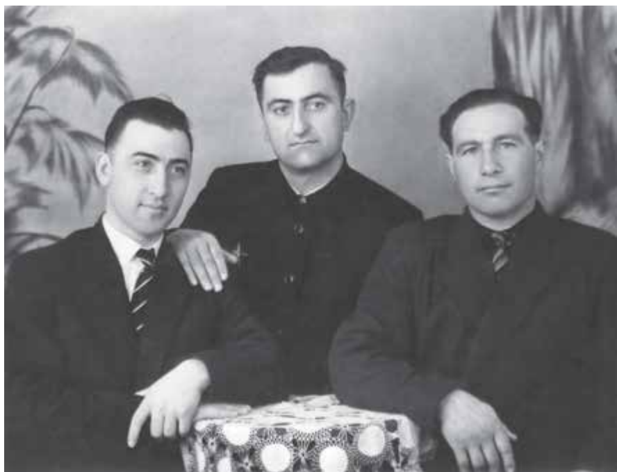
Тёппеланы Алим нёгерлери бла