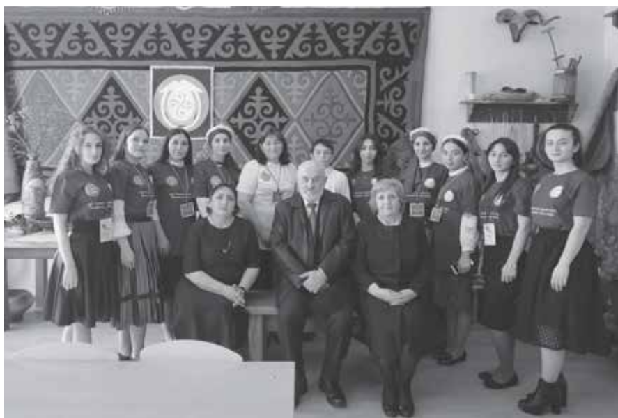
Маданият арада тубешиу