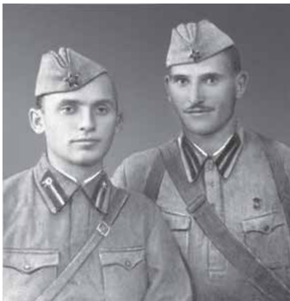
Солдан онгнга: Керим аскерчи нёгери бла