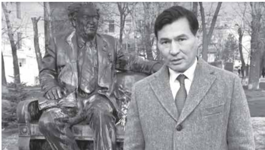
Къалмукъ Республиканы башчысы Бату Хасиков