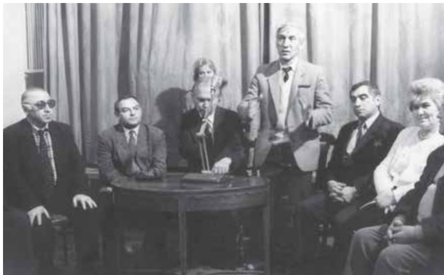
Алим редколлегияны жыйылыуунда