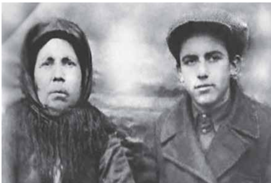
Керим анасы бла