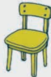
Шэнт – стул