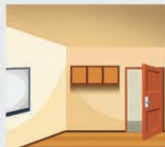
ПкІафэ – потолок