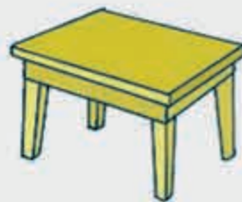
СТЮл – стол