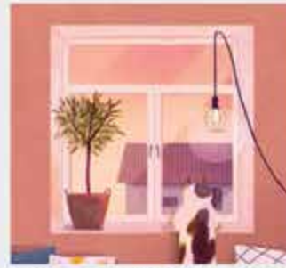
Щхьэгъубжэ – окно, щхьэгъубжащхьэ – подоконник