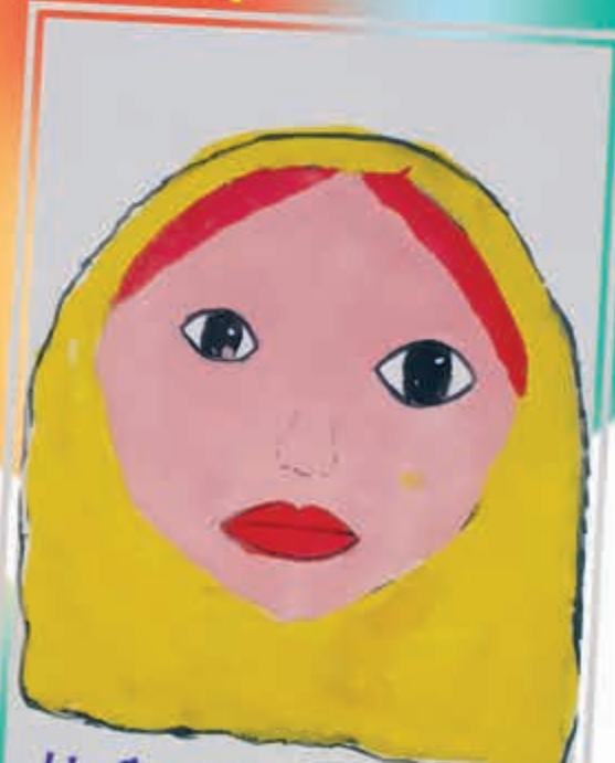
Ныбжыгъум и сурэт