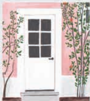
Бжэ – дверь, дэКіуеипІэ – ступень