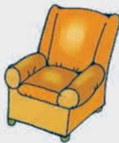
Шэнтиуэ – кресло