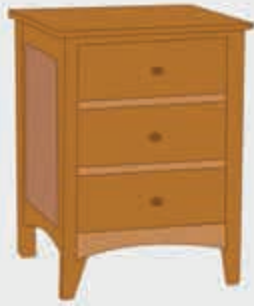
Къыдэгъэж – тумбочка