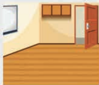
Унэлъэгу – пол