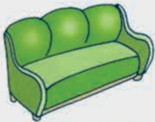
Шэнтжъей, тахътэбан – диван