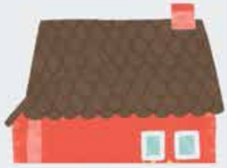
Уэнжакъ – дымоход, унащхьэ – крыша