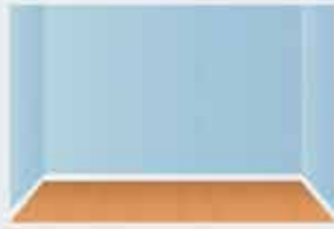
Блынджабэ – стена