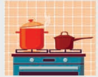
Газ хъэку – газовая плита

Жып псалъатъэр зыгъэхъэзырар ХЪЭЛИЛЭ Миланэщ