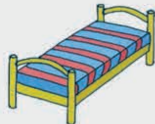
ГъуэлъыпІэ – кровать