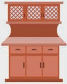
Сырэ – посудный шкаф