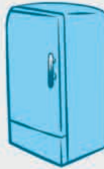
ЩыӀалъэ – холодильник