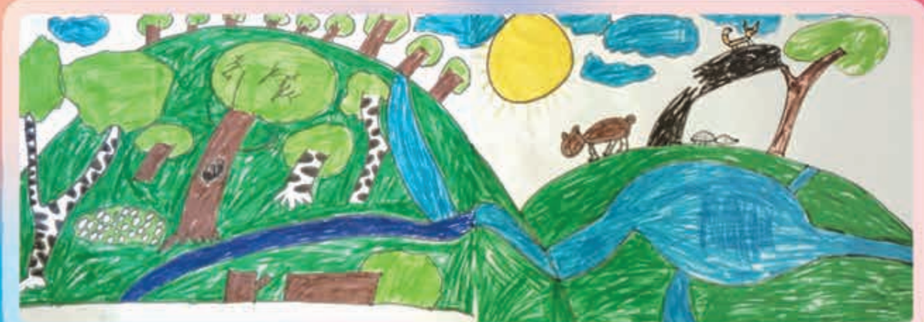
"Дунейр къабзэну сыхуейщ". Гъуэгунукъуэ Тамилэ, Псыгуэнсу, илъэси 9