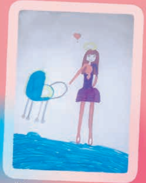
"Шыпхъу сыхуейщ". Быф Арианэ, Альтуд, илъэси 9