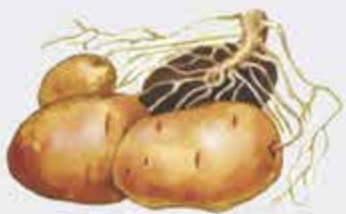
ЛъабжьэщIэкIэ - клубень, корнеплод