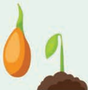
Жылэ – семя, кумылэ – сердцевина