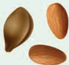
Купкъ – косточка, купщІэ – ядро