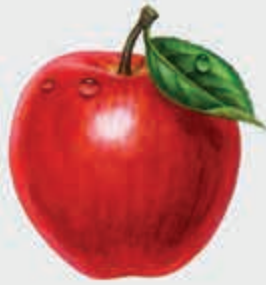
Пхъэщхъэмыщхъэ – плод