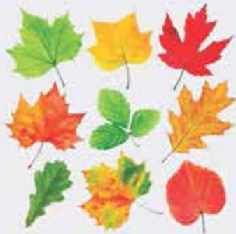
ПщІащэ – листва