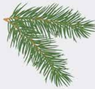
КхъуакІэ – хвоя