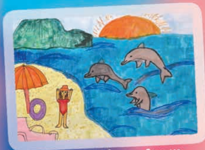
"Тенджыз Iуфэм". Судым Арианэ, Нарткъалэ, илъэс 11