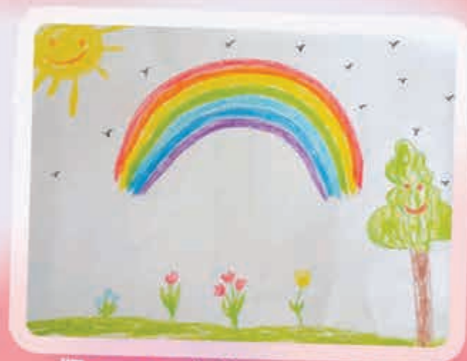
"Гъзмахуэ". Хакимова Дарьяна, Мэзкуу, илъэси 3