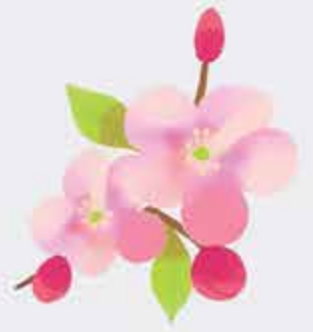
Гъэгъа – соцветье