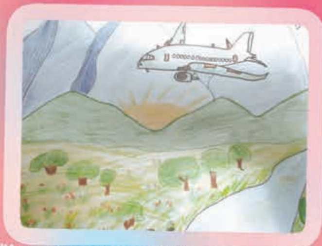
"Кхъухълъатэзехуэ". Къаныкъуэ Алан, Дыгулыбгъуей, илъэси 10