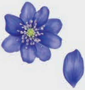
КъапщИй – лепесток