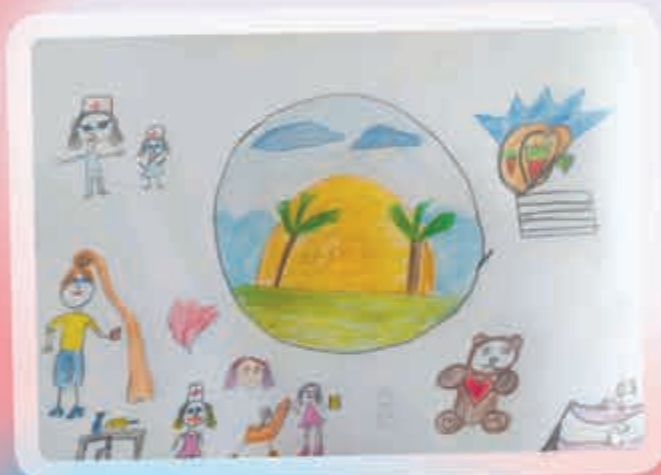
"Шыпхъу цыкIу". Къаныкъуэ Алинэ, Дыгулыбгъуей, илъэси 7