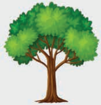
Жыг – дерево

Жып псалъатъэр зыгъэхъэзырар ХЪЭЛИЛЭ Миланэц