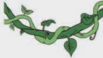
Жыгдэжей – лиана