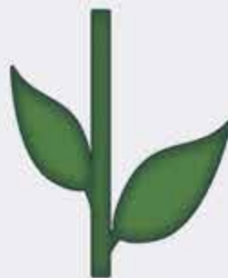
Къуэпс - стебель растений