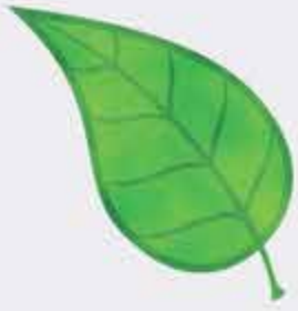
Тхъэмпэ – лист