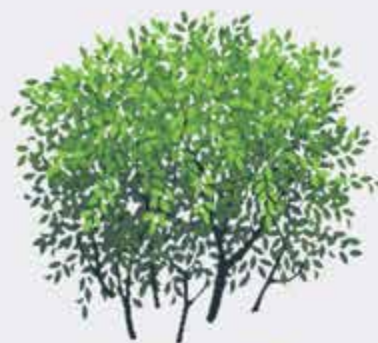
Гъурц - куст, гъуей - кустарник