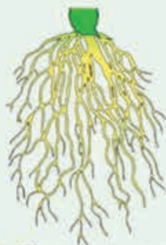
Лъабжьэ, лъахъц – корни