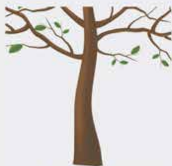
Лъэдий - ствол, къудамэ - ветка