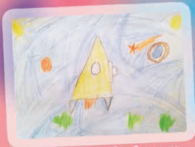
"Солъатэ". Къамбот Алихъан, Астэмрей Ипщэ, илъэси 7