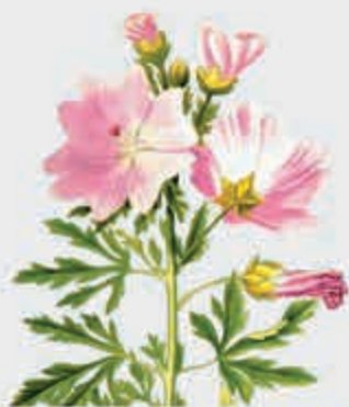
Губгъуэmatэкъуей – хатъма тюрингенская