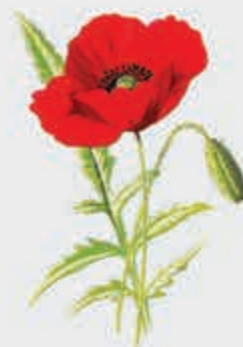
ГубгъуэИуцхьэ – мак