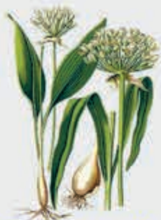
Губгъуэбжыныху – черемша, дикий чеснок