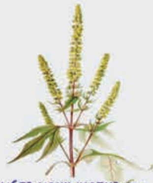
Губгъуэжыхапхъэ – амброзия полынно-листная

Жып псалъалъэр зыгъэхъэзырар ХЪЭЛИПЭ Миланэц