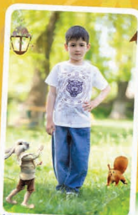
Щомахуэ Залым, илъэсибл, Зеикъуэ