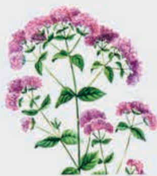
Губгъуэдадий, губгъуэшей – душица