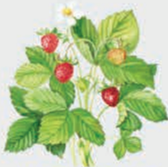
ГубгъуэмэракIуэ – земляника лесная