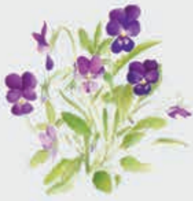
Губгъуэбалыджэ – ночная фиалка