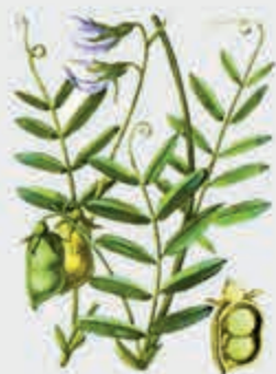
Губгъуэджэш – чечевица пищевая