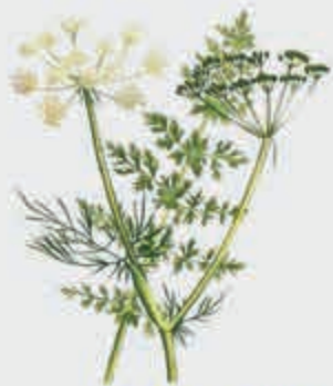
Губгъуэпхъ – тмин кавказский