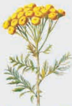
Губгъуэудашъэгъуэжъ – полевая рябинка