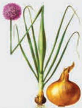
Губгъуэбжын – полевой лук