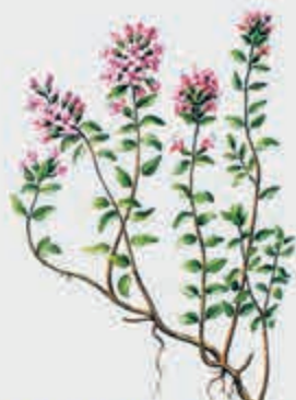
Губгъуэдыгъумэ – мята полевая