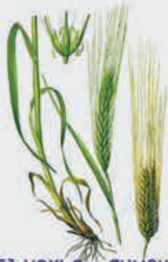
Губгъуэхъз – ячмень дикорастущий