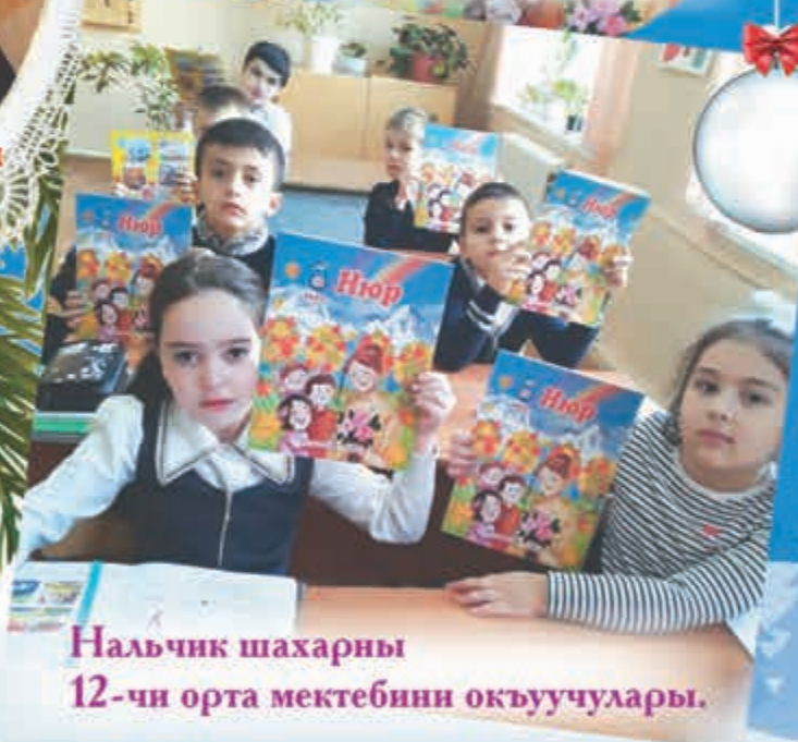
Нальчик шахарны 12-чи орта мектебинн окъуучулары.

Ежемесячный литературно-художественный журнал для детей на балкарском языке