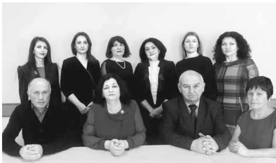
Къэбэрдей-Балькъэрым Гуманитар къэхутэныгъэхэмкІэ и институтым адыгэбзэмкІэ и къудамэм и лэжъакІуэхэм я гъусэу. 2021