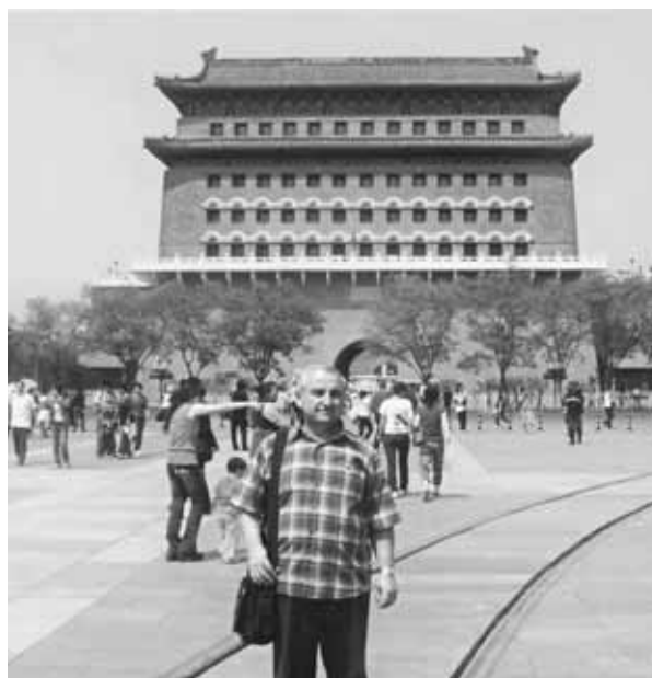
Китайм и къалашхъэ Пекин зыщеплъыхь. 2007