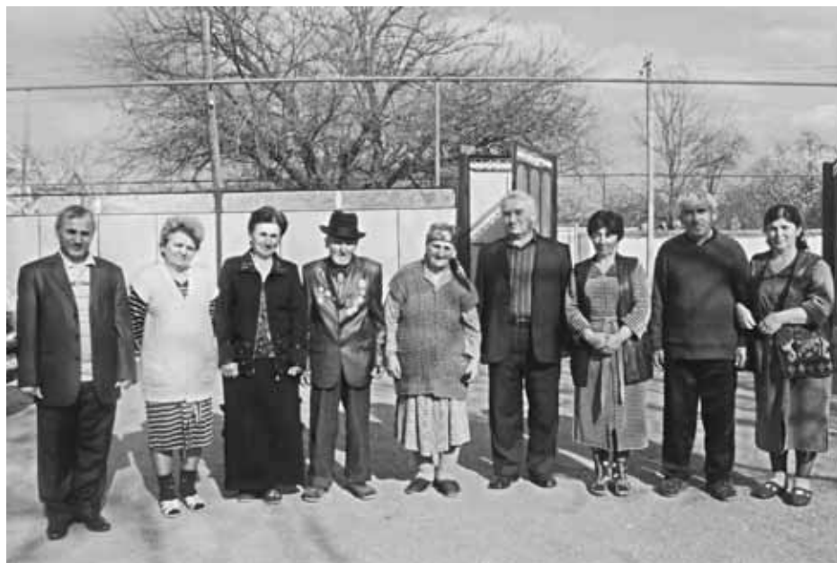
И унагъуэмрэ и Ыхьыхэмрэ я гъусэу. Хьэтуей къуажэ. 2010