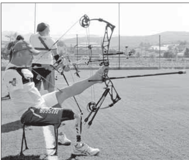
Большие фото на сайте smkbr.ru.