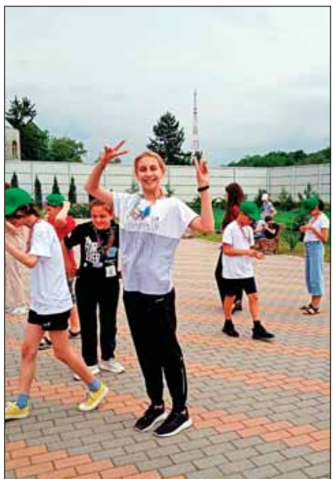
Фото автора и участников профильной смены «Медиа-Антарес».